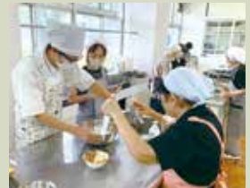
高齢者の方々と交流する 食事会の開催

まち全体を学び場に、様々な人たちと出会い、地域のことを学ぶ中で、自分たちにできることを考え実践していく「手づくり」の授業です。1年生はフィールドワーク、しごと体験、聞き書きを通して地域に触れ、2年生は興味のあるテーマを選び、チームでの協働プロジェクトに挑戦します。最終学年では3年間の集大成として、探究したいテーマを見つけ、自ら計画を立てて取り組みます。