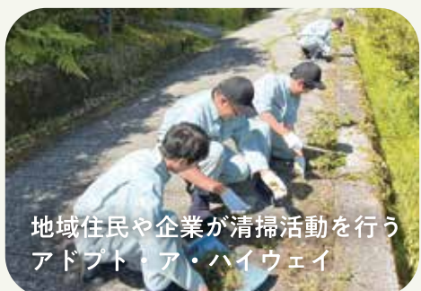
地域住民や企業が清掃活動を行う アドプト・ア・ハイウェイ

農業後継者の減少に伴う耕作放棄地「まめのくぼ」で、棚田の再生・管理から在来小麦の栽培、加工、販売までを目指して実践的な学びを行っています。また、石積み改修や間伐などの景観保全の活動を展開しています。