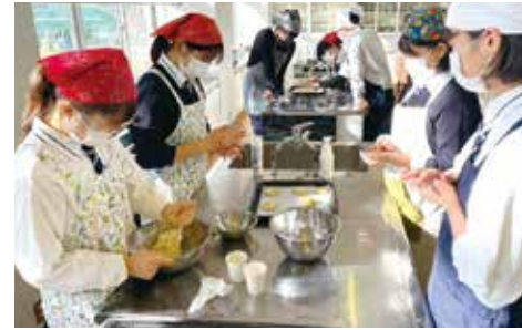
科目 | フードデザイン