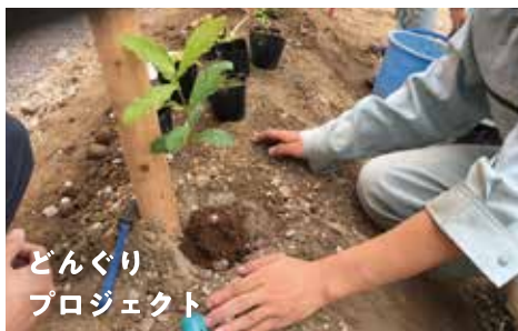
科目 | 造園植栽