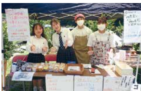
科目 | 地域資源活用