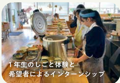
1年生のしごと体験と 希望者によるインターンシップ