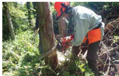
科目 | 森林科学