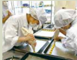
子どもたちの苦手な野菜を 使ったクッキー開発