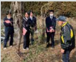
地域の先輩から学ぶ 聞き書き体験