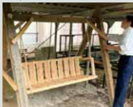
木を活用したものづくり としてブランコを制作