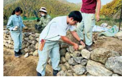
科目 | 神山創造学IIα