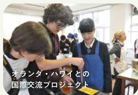
オランダ・ハワイとの 国際交流プロジェクト