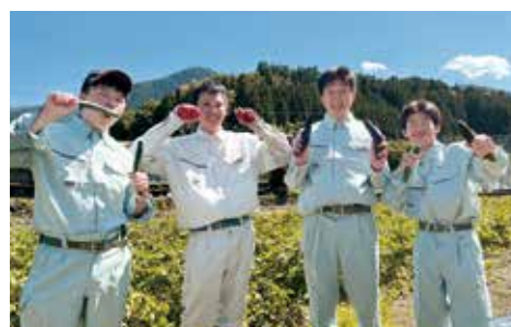
科目 | 野菜