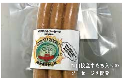
科目 | 食品製造