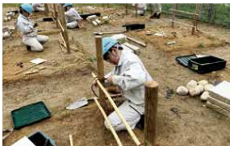
科目 | 造園施工管理