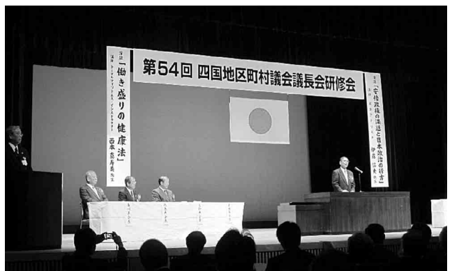
第54回四国地区町村議会議長会研修会

あり地元町長の挨拶、自治功勞者の表彰が行われたのち、マスコミにもよくでている、政治アナリストの伊藤惇夫氏より「安倍政権の課題と日本政治の行方」とのタイトルで講演が行われ「一強多弱の政治構造は何をもたらすか」「二大政党制は間違いであったのでは」「好調・安倍政権の背景にあるもの」今のマスコミは安倍総理に対し概して甘い。アベノミクスという言葉で国民に期待感をもたらした、