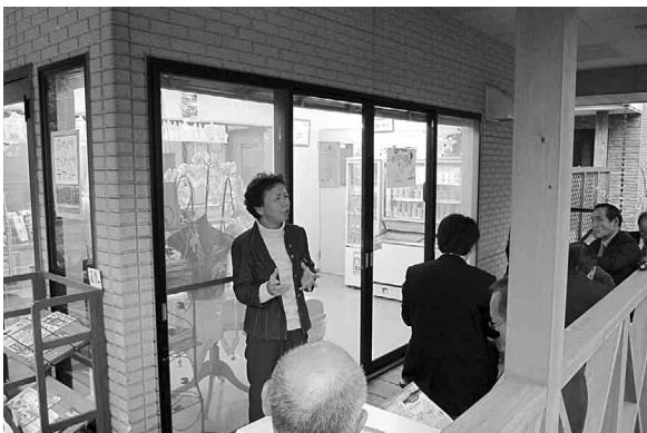
ジェラート工房ドナ