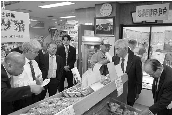
6次産業の製造販売所

法人等66団体が参加したネットワークを形成し様々な活動をしている。ネットワークのメリッ