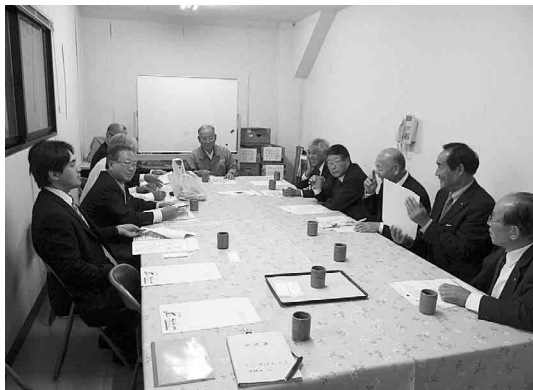
世羅町での行政視察

トとして連携によって他の施設や資材が利用できる、より高度な研修が合同で受けられる、お客様を共有でき連携して呼び込める、ブランド化しやすい、イメージが強化される、協力して大型イベントができる、協力してお客様を満足させることができる、マスコミに取り上げられやすい、お互いに情報交換ができる、行政期間の支援が受けやすい等が挙げられた。ネットワークでは様々な加工品を製造販売しており年間100万円を