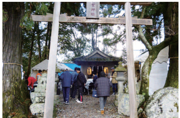
参拝者で賑わう「えびすまつり」

えびすまつり（腰之宮神社） 神領宇大埜地の腰之宮神社に祀られている「えびす」は七福神の一柱であり、日本古来の福の神として親しまれている。古くから大埜地区でも祀られているが、村おこしを目的に平成19年から、1月10日を目的にすまつりとし、お接待や福俵・だるま・クマデの販売を始め、200人余りの参拝者で賑わうようになった。