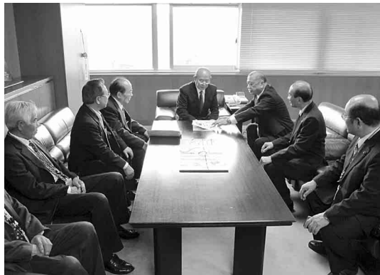
国土交通省への陳情

バイオマス産業都市とは経済性が確保された一貫システムを構築し、地域の特色を生かした（間伐材・堆肥、生ゴミ、等）バイオマス産業を軸とした環境にやさしく災害に強いまち、むらづくりを目指す地域。としてバイオマス産業都市構想に募集を募り、選定されると関係府省による連携支援（事業化支援）しようとするもので全国8市町