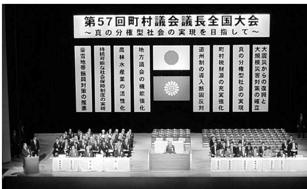
第57回町村議会議長全国大会

大会（第38回豪雪地帯町村議会議長会を併せて開催）は11月13日、東京NHKホールにおいて、昨年引き続き「真の分権社会の実現を目指して」をメインテーマに開催された。蓬清全