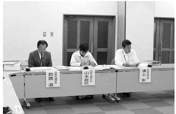
情報通信基盤整備事業の説明