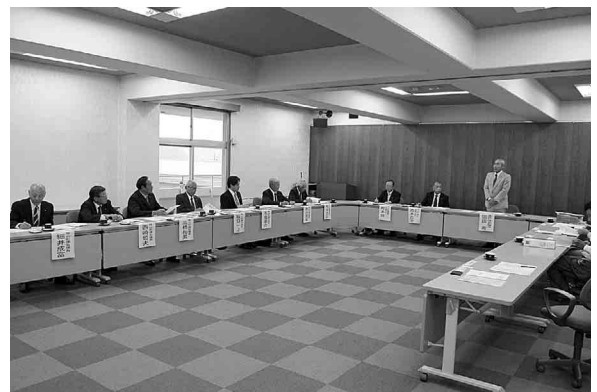
美咲町での行政視察