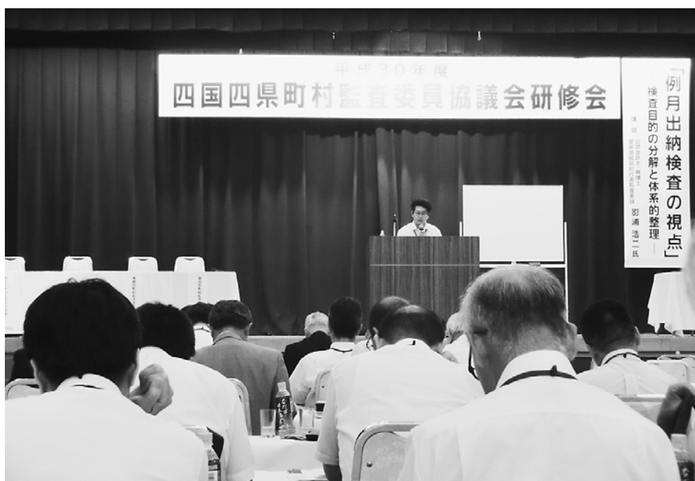
四国四県町村監査委員協議会研修会の様子