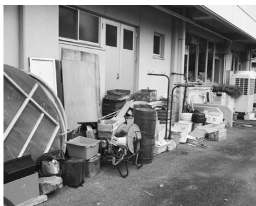
農村環境改善センター西側

前例踏襲にこだわることなく改革していくことは大切なことだと考えております。下校前には時間割をするかどうかについては学校長の権限にあり学校長に対してはこうした事も踏まえ保護者に理解していただきながら根気強く指導してもらいたい。