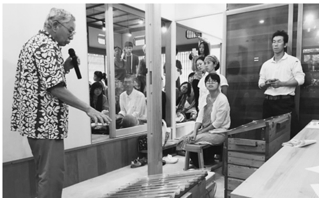
西分の家でのキエー口説明会

文部科学省から通知されたことについては、すでに町内の学校では適切な配慮ができていますが、今後ともより適切な配慮ができるよう指導していく。