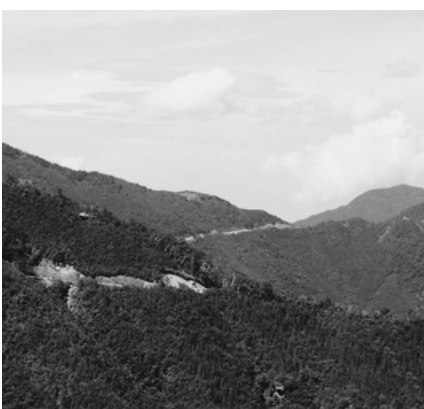
天神丸風力発電建設予定地

(イ)県と町の意見の温度差について、町の方がちよつとやさしいののではないかととらえ方と思うが、中身については表現よりはるかに厳しいものであることを表明させて頂きたい。 (ロ)1市2町の協議会の起ち上げについては、各々の自治体の実情が違うことから難しいのではないかと思う。 (ハ)太陽光発電の適地がほとんど国内で実施されていることから、中山間地への計画が進出していることから、課題も多くある。自然環境への影響、土砂災害等への配慮を考えて、建設については慎重に対応する必要があると考える。