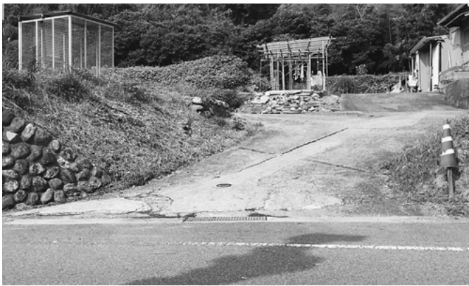
歯ノ辻団地進入路

河川を管理する徳島県の河川占有許可が必要で、河川協議の結果「潜水橋であれば認める」ということで施工しているの