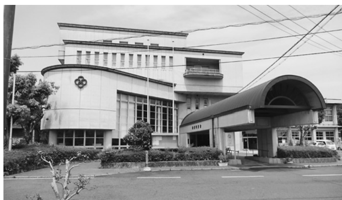
視察先の和東町役場

5月16日より3日間、勝名地区監査委員、事務局14名で京都市和東町、大山崎町の視察研修に参加。和東町は、昭和29年12月に合併して発足し、京都府南部、奈良県の北に位置しており、周囲を山に囲まれその麓の谷間に集落が点在、人口4026人の町である。周囲を山に囲まれた土地ゆえに、かつて和東の名が広く知られることはほとんどありませんでした。その中で和東の町と他の地域を繋いだものこそがお茶でした。和東町に息づく宇治茶生産800年の歴史は、和東の茶農家の情熱と谷の地形があつてこそ、現在に至る