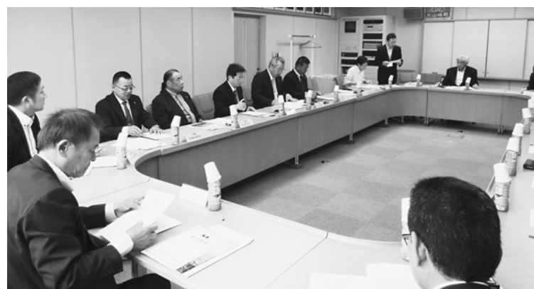
大山崎町での研修

産量1251t、荒茶生産金額3038百万円、製茶工場数129工場と、現在和東で生産される茶葉は、京都府産の約半数を占め、その品質からも和東のお茶は全国有数の高級茶の一つに数えられています。和東町の監査実施状況、月例監査実施状況、決算監査実施状況についての研修説明があり、意見交換を行った。 大山崎町の歴史は古く、明治22年の市制町村制施行とともに、大山崎荘・円明寺村・下植野村の3つが合併して大山崎村になり、昭和42年11月には人口の増加にともない大山崎村から大山崎町となり現在に至っており、京都府内で一番面積の小さい5・97km 2 で、コンパクトさを