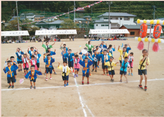
小学生による阿波おどり