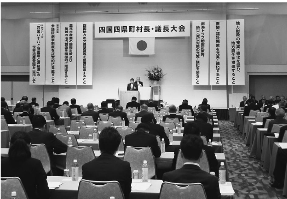
四国四県町村長・議長大会の様子

を打つ。紙面の都合で詳細は割愛するが、今は企業誘致ではなく、優秀な個人誘致であるとの話しに故郷思考の強い企業経営者の言葉にはうなづかされた。 (西崎哲夫)