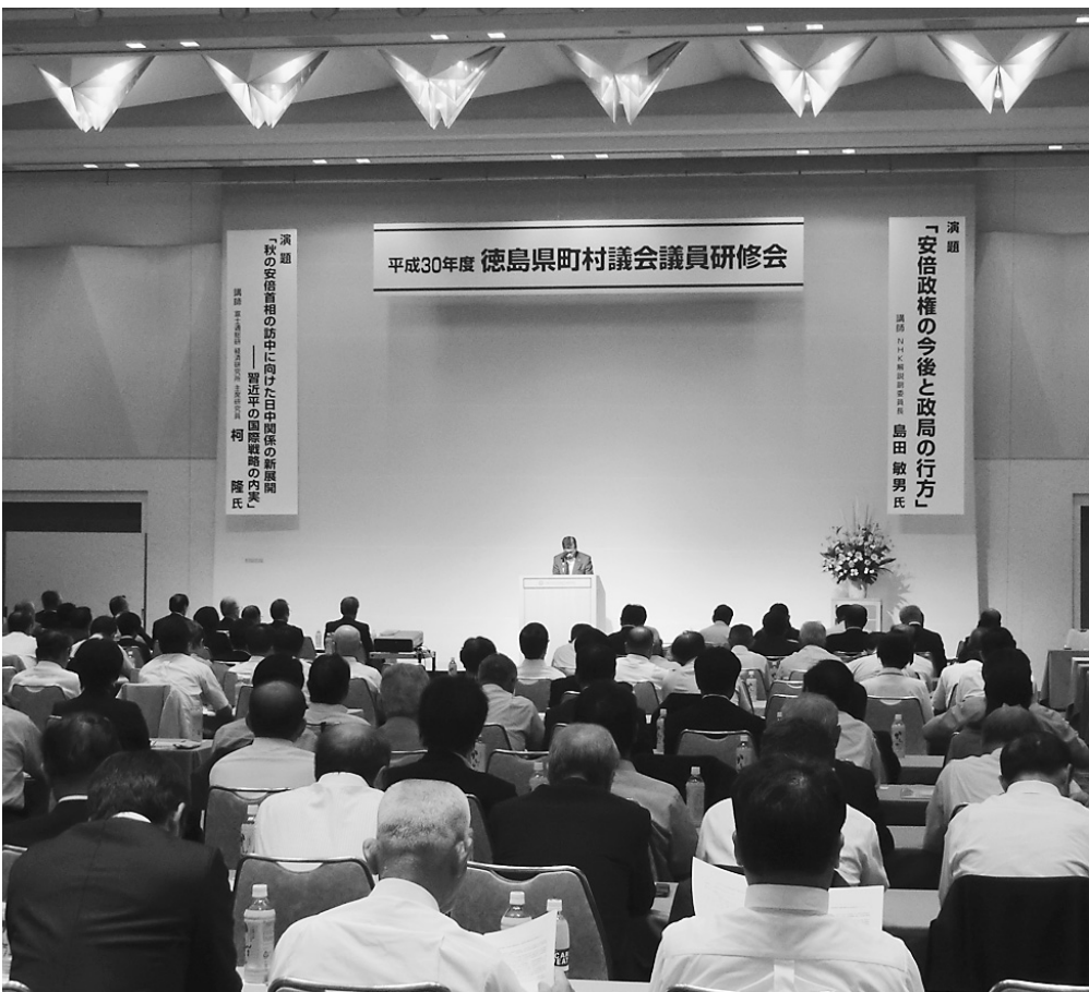
徳島県町村議会議員研修会の様子