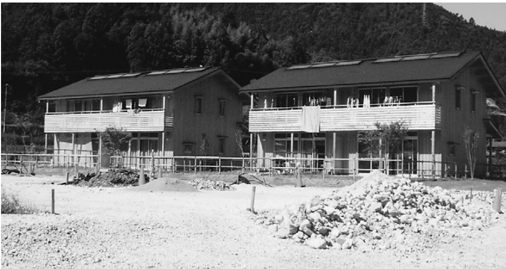
新築なった大埜地住宅