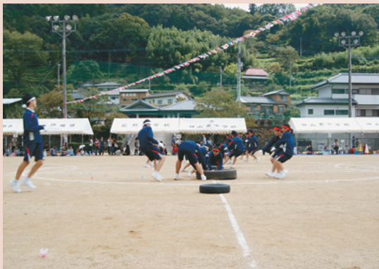
南岸北岸綱引き大会