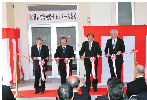
学校給食センター落成式でのテープカット