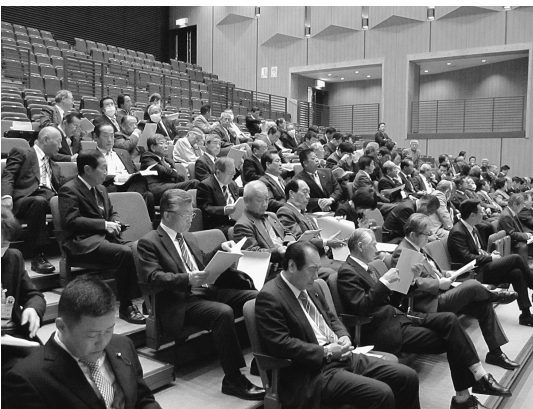
石井町中央公民館での議員研修会