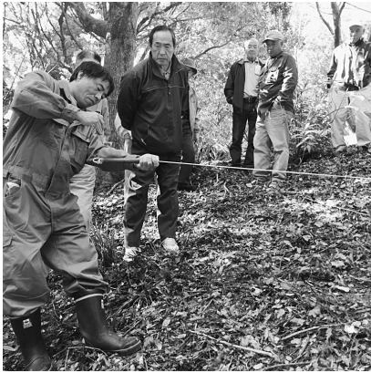
くくり罠の講習会

を効果的に捕獲するため、くくり罠でも捕獲許可を出す予定である。猿と鹿が対象である。