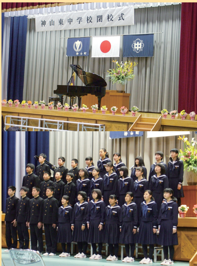
卒業生と在校生が一緒になって校歌斉唱中

3月24日(木)午後2時より3月に卒業した生徒、在校生、地元住民、旧職員、卒業生、多くの人々が出席し、思い出深い校舎とお別れをした。昭和45年6学級208名で広野中学校から神山東中学校と校名変更し発足、1477名の卒業生を送りだしたが、少子化の影響から46年の歴史に幕を下ろすことになった。広野中学校からの卒業生は3505人である。記念誌「飛翔」〜至誠を胸に〜と記念のDVDが出席者に配られた。閉校時の在校生は18名だった。