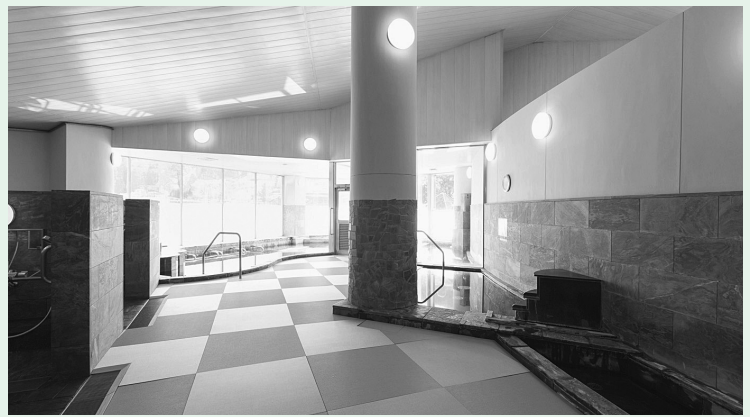
リニューアルされた神山温泉浴場

●ふるさと納税に84名から183万円のご寄附をいただいているが、今後も多くの方からご寄附をいただけるよう努力したい。