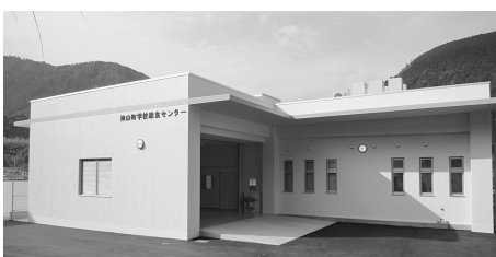
完成した神山町学校給食センター